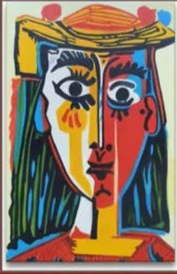
Petronella Pablo Picasso